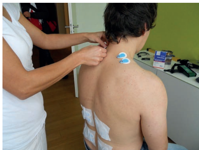
Platzierung der Elektroden an der Schulter (M. trapezius, Pars descendens)